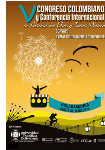
V CASAP - 2015