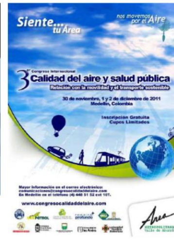
III CASAP - 2011