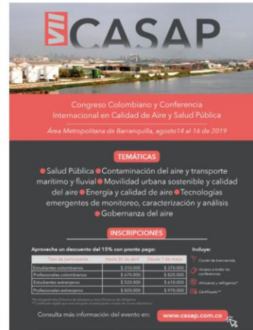
VII CASAP - 2019