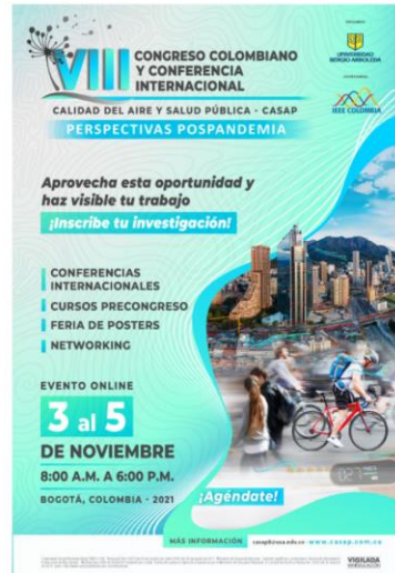
VIII CASAP - 2021