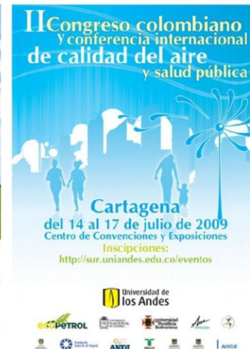
II CASAP - 2009