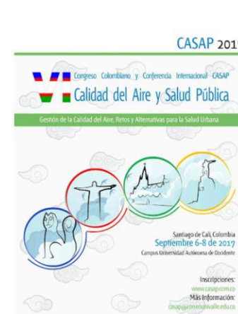
VI CASAP - 2017