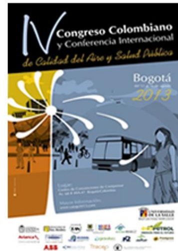
IV CASAP - 2013